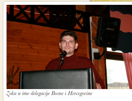
Žoka u ime delegacije Bosne i Hercegovine

Najvjerojatnije ćemo i ostati na Bjelolasici, jer kao što smo konstatirali, nakon tri godine smo se treći puta vratili doma i tu namjeravamo i ostati.