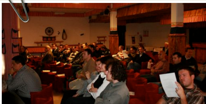
Članovi na Skupštini

Prvog dana okupilo se nas dvadesetak u rano poslijepodne 5. studenog sa namjerom da pretresemo sve trenutne probleme u podružnicama naše Udruge na sastanku Izvršnog odbora HUKL-a, ali i analiziramo rad tijekom proteklih 13 mjeseci od prošle skupštine.